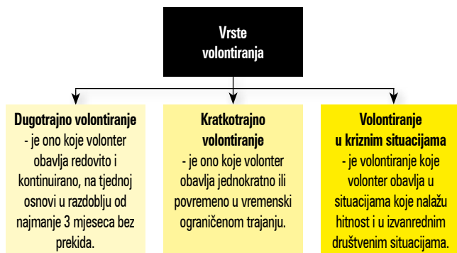
Slika 1. Vrste volontiranja